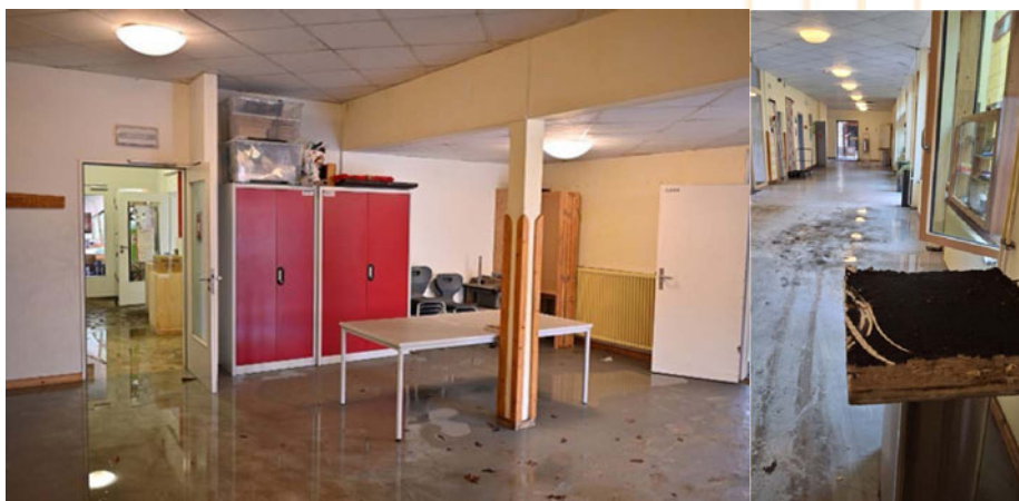
Vor dem großen Eurythmiesaal Blick Richtung Lehrerzimmer und EG-Flur drei Tage nach dem Brand

Eine weitere Herausforderung wurde Ende vergangener Woche sichtbar: Das Löschwasser, welches vom Lehrerzimmer bis über den Hauptflur in Höhe des Serverraums knöcheltief stand, hat offensichtlich Eingang in die Kokosfaserdämmung unter dem Estrich gefunden. Von daher werden wir auch in die Tiefe zurückbauen müssen. Der Umfang wird durch Teilöffnungen noch ermittelt.