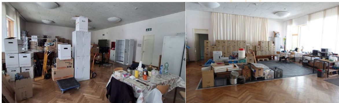
Zwischenlager im großen Eurythmiesaal