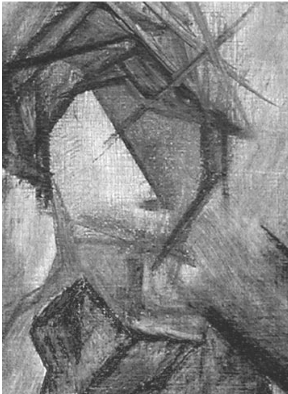
Ausschnitt aus einer Arbeit zum Thema Farb- und Form-Durchdringung, 12. Klasse